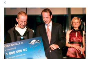
1-2 Projekt Zdravotní klaun 3 Předávání ceny pro občanské sdružení Ledovec

...Prostřednictvím technologií a služeb společnosti Telefónica O2 podporuje Nadace též projekty, které rozšiřují možnosti pro lidi s postižením.